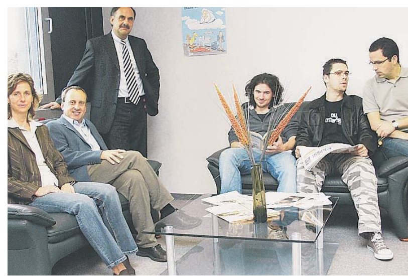
Die neue Leseecke der FH-Bibliothek.