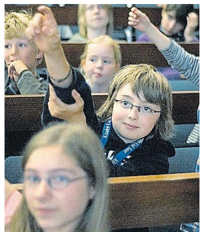
In der Kinderuni werden junge Menschen zu Nachwuchsakademikern.