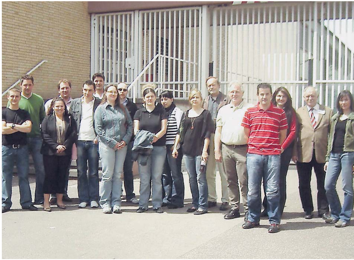
Bei ihrem Besuch in der JVA erfuhren die Studenten Spannendes zur Geschichte der Anstalt.

Ohler will seine Vorlesungen im Herbst mit dem Thema „Reise zum Mittelpunkt des Rechts“ fortsetzen. Dann soll auch ein Gericht besucht werden: „Hierfür war in diesem Semester leider keine Zeit.“