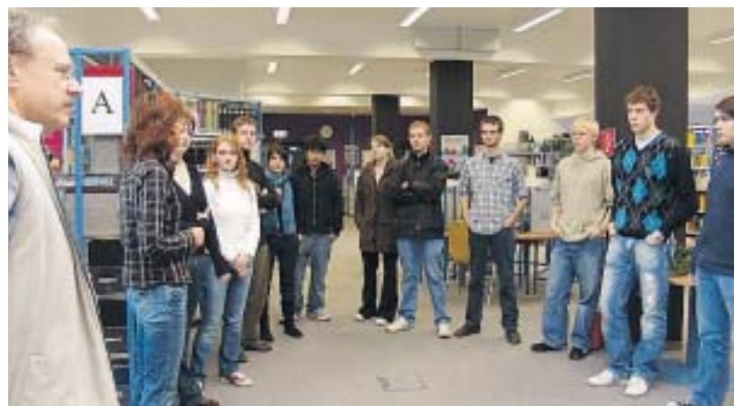
Neugierig waren die Schüler des er Helmholtz-Gymnasiums bei ihrem ersten Besuch in der FH-Bibliothek.

Zweibrücken. Bislang waren die Vorzüge der FH-Bibliothek auf dem Zweibrücker Campus ausschließlich den Studierenden vorbehalten. Doch das war einmal. Vor einer Woche hat die Hochschuleinrichtung ihre Türen