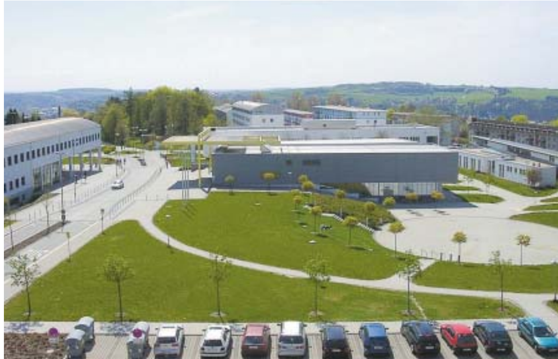
Auf den Zweibrücker Campus strömen nächste Woche die Erstsemester. Die Einführungstage sollen ihnen helfen, sich zurecht zu finden.

Los geht es um zehn Uhr im Raum 114 im C-Gebäude (hinter dem Audimax und gegenüber der Campus-Kneipe „Plan B“). Vizepräsident der FH, Professor Thomas Zimmermann, Dekan Thomas Walter und Prodekan Konrad Wolf werden die Neankömmlinge feierlich begrüßen. Im Anschluss, etwa ab 10.45 Uhr, stellen sich sämtliche zentrale Einrichtungen der FH vor. So werden das Studierendensekretariat und Prüfungsamt, die allgemeine Studienberatung, das Dekanat I/