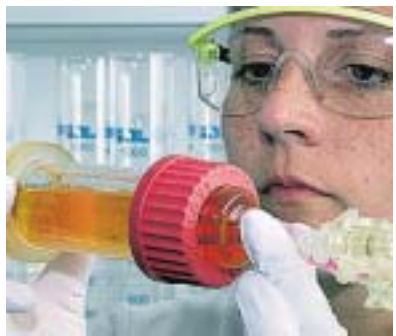
Die Forschungsbedingungen sollen verbessert werden.

Zusätzlich zu den rund 700 Millionen Euro stellt der Bund den Ländern bis 2013 jährlich einen Betrag von 298 Millionen Euro für Forschungsbauten und Großgeräte von überregionaler Bedeutung zur Verfügung. „Damit fördern wir internationale Wettbewerbsfähigkeit und verbessern die Forschungsbedingungen“, sagte Schavan. Der Bund stellt damit mehr Geld zur Verfügung als in den vergangenen drei Jahren des Hochschulbauförderungsgesetzes. Ende 2006 erfolgte die Abschaffung der Gemeinschaftsaufgabe „Ausbau und Neubau von Hochschulen einschließlich der Hochschulkliniken“. red