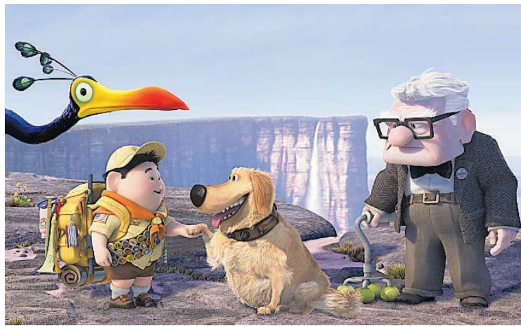
Los geht es heute Abend im Campus-Kino mit dem Pixar-Animationsfilm „Oben“.