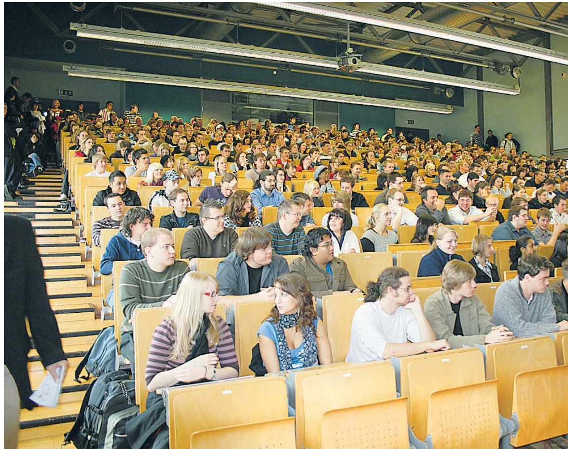
Das Audimax der FH ist ab sofort wieder Schauplatz des Campus-Kinos.

Um so viel Kinoatmosphäre wie möglich zu schaffen, wurde das Campus-Kino von der Studentenkneipe Plan B (ehemals Campino) in das Audimax verlegt. Bei diesen Vorstellungen handelt es sich um einen studentischen Filmclub, der nur für Studierende ist. Gegen Vor-