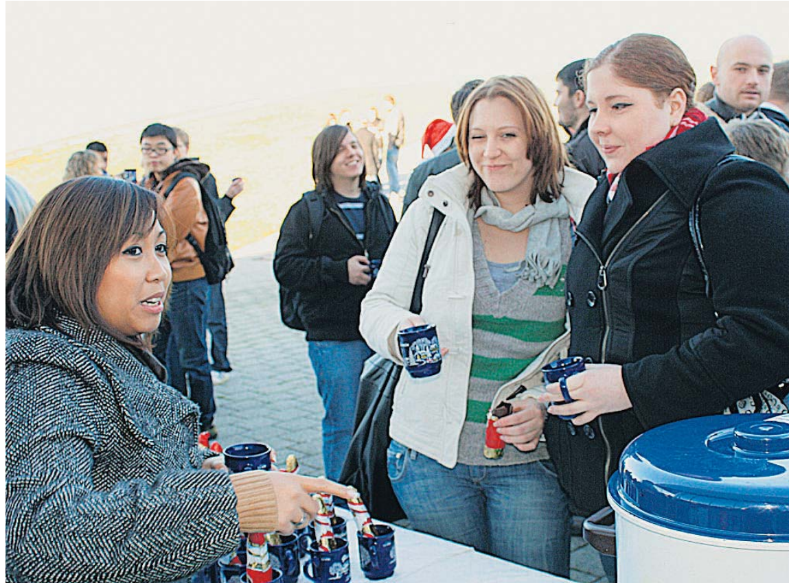
Die Studenten ließen sich den Glühwein schmecken.