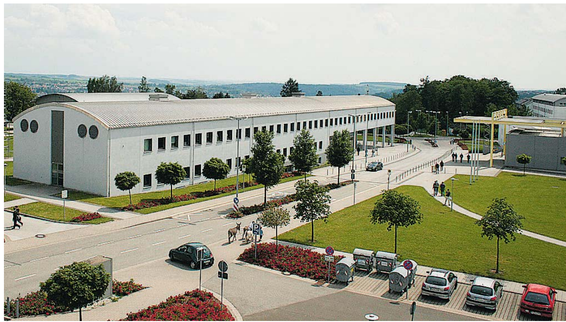
Für Zweibrücken haben sich die meisten Studenten eingeschrieben.

Während bei den Bachelorstudiengängen der Fachhochschule (FH) Kaiserslautern die Immatrikulationsverfahren zum Wintersemester 09/10 weitgehend abgeschlossen sind, dauern diese im für die weiterführenden Studiengänge wie Master und weiterbildende Studiengänge noch an. So kann zwar zum aktuellen Zeitpunkt noch kein abschließendes Einschreibungsergebnis ermittelt werden, dennoch beleuchten die Zahlen bei den grundständigen Studiengängen die Entwicklung der FH. Bis zum 15. September haben sich insgesamt 1165 Erstsemester in den Bachelorstudiengängen eingeschrieben. Damit liegt die Hochschule nur knapp unter den Werten der beiden Vorjahreszeiträume (WS 08/09: 1241; WS 07/08: 1304). Dabei haben sich 497 (559; 629) Neueinschreiber für ein Studium am Standort Kaisers-