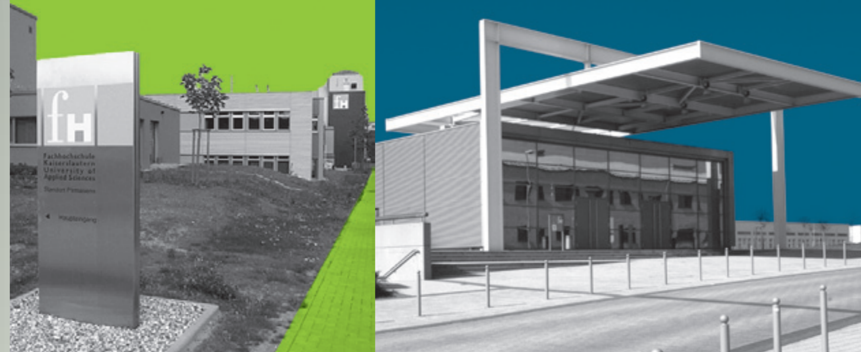
↑ Campus Pirmasens

Modernes Produktionsmanagement in einer globalisierten Welt erfordert die Fähigkeit, komplexe Produktionsprozesse ganzheitlich zu erfassen, zu analysieren und unter Aspekten wie Wirtschaftlichkeit, Qualität und Zeit zu optimieren. Im Schwerpunkt Produktionsmanagement werden daher Fachgebiete wie Qualitätsmanagement sowie Produktionsorganisation und Methoden wie z.B. Projektmanagement und Wertanalyse vertieft vermittelt.