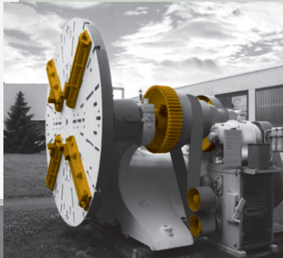
→ Campus Kaiserslautern

Die Fachhochschule Kaiserslautern versteht sich als moderne Hochschule für angewandte Wissenschaften und Gestaltung. Über 5400 Studierende und etwa 160 Professoren und Professorinnen lernen, lehren und forschen in fünf Fachbereichen und an drei Studienorten, in Kaiserslautern, Pirmasens und Zweibrücken. Zahlreiche Partnerschaften mit in- und ausländischen Hochschulen und Kooperationen mit Unternehmen stellen nicht nur ein praxisorientiertes und internationales Studienangebot, sondern auch wissenschaftliches Know-how auf höchstem Niveau sicher.