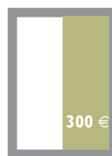
1/2 Seite Innenteil hoch 85 x 259 mm