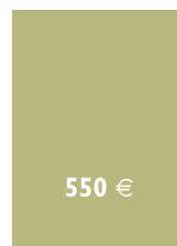
1/1 Seite Umschlag Seite 2 oder 3 210 x 297 mm