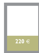
1/3 Seite Innenteil quer 175 x 86 mm