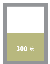
1/2 Seite Innenteil quer 175 x 129,5 mm