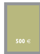
1/1 Seite Innenteil 175 x 259 mm